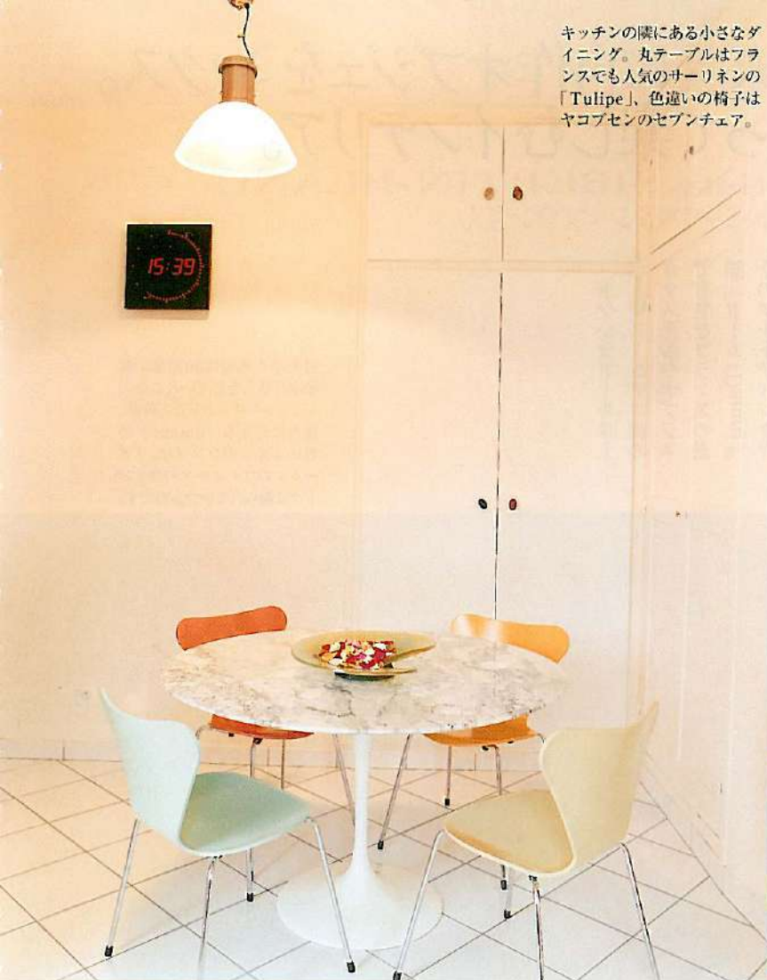
キッチンの隣にある小さなダイニング。丸テーブルはフランスでも人気のサーリーネの「Tulipe」、色違いの椅子はヤコブセンのセブンチェア。