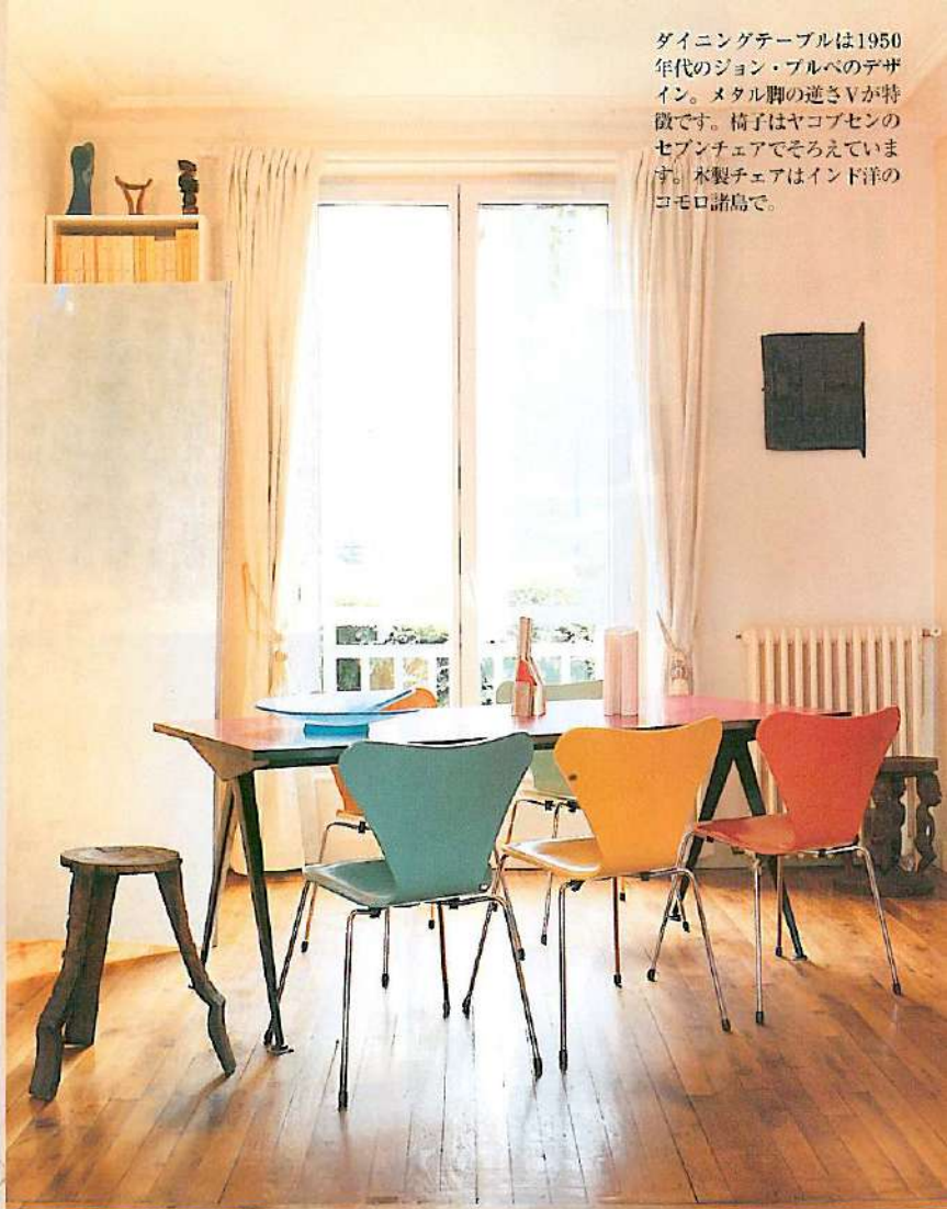
ダイニングテーブルは1950年代のジョン・フルベのデザイン。メタル脚の逆さVが特徴です。椅子はヤコブセンのセブンチェアでそろえています。木製チェアはインド洋のコモロ諸島で。