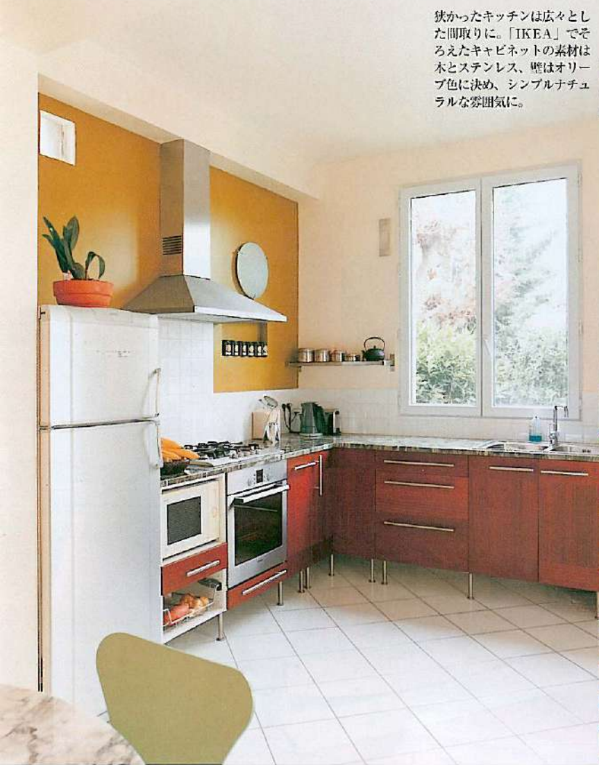
狭かったキッチンは広々とした間取りに。「IKEA」でそろえたキャビネットの素材は木とステンレス、壁はオリーブ色に決め、シンプルナチュラルな雰囲気に。